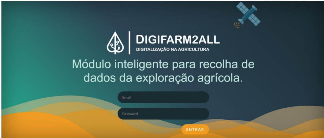
Apresentação geral de entrada na plataforma DigiFarm2all